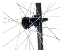
Ruedas de liberación rápida